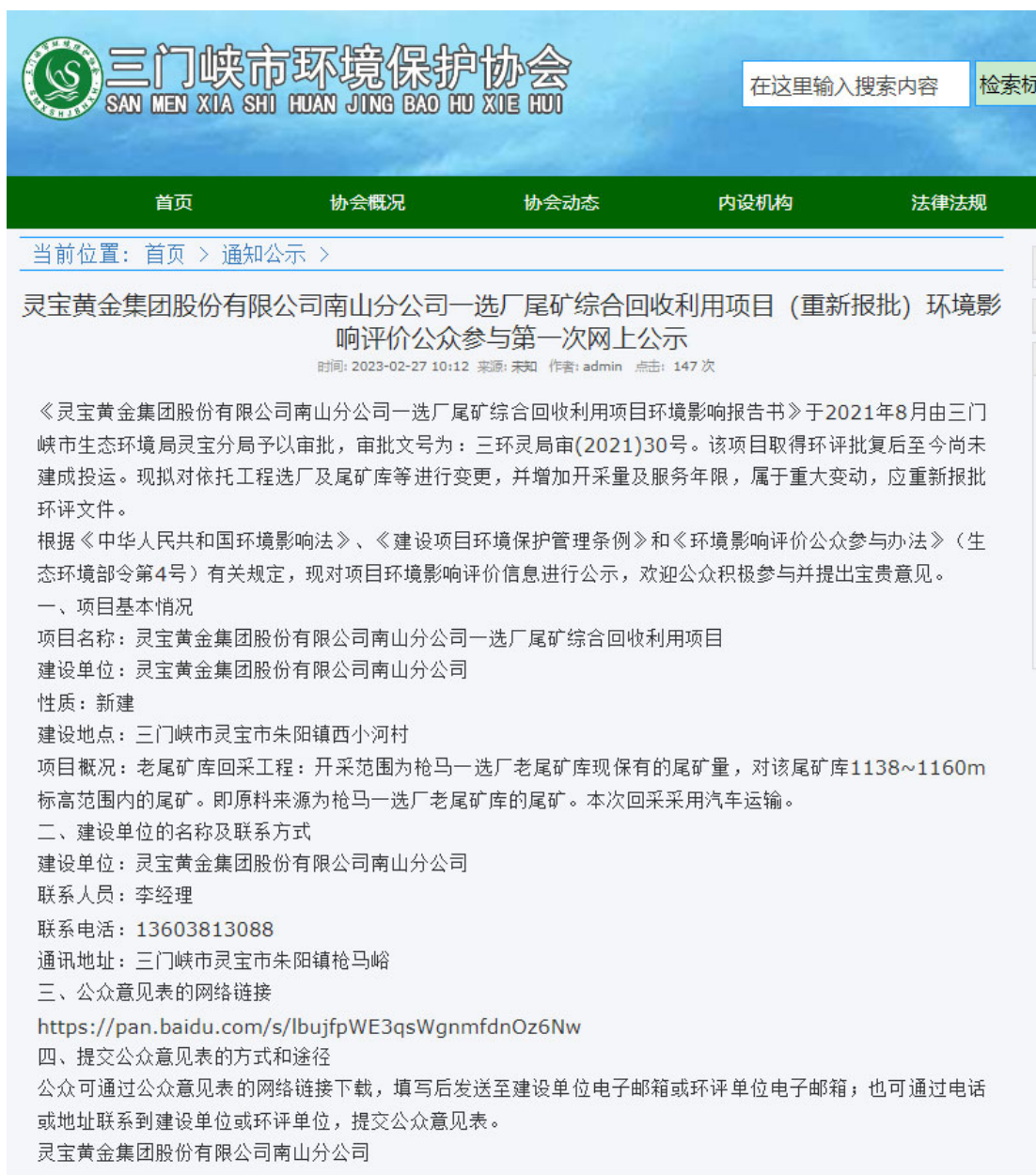
图 1.2 第一次网络公示页面截图