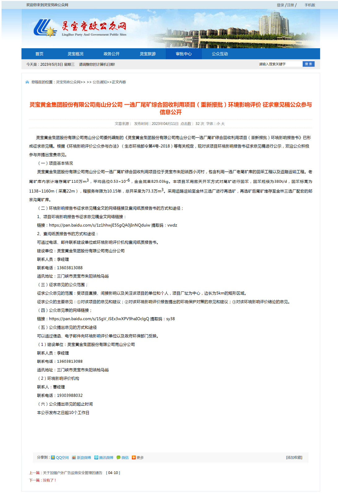
图2 第二次网络公示页面截图